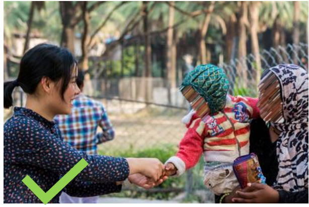
Trayendo las noticias del Jefe a una familia del Medio Oriente.